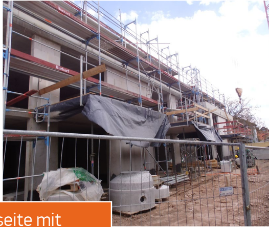
Südseite mit auskragendem Balkon