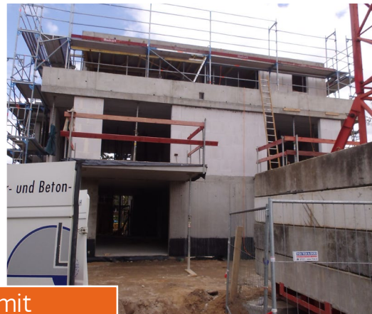
Südseite mit auskragendem Balkon